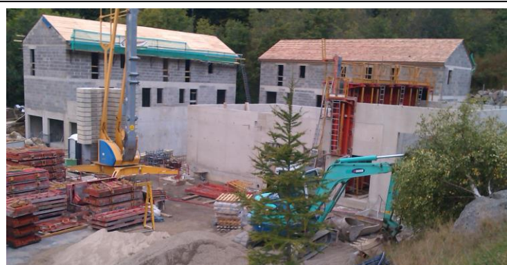
Photo de la nouvelle gendarmerie d'octobre 2014

Les travaux de la gendarmerie à l'Estournal au Pont de Montvert (4 logements + locaux et garages de la gendarmerie) sont bien avancés (hors d'eau et hors d'air). L'école professionnelle de la pierre sèche à l'Espinassas est aussi en voie de finition (bâtiment de travail sous la route opérationnel et bâtiment sur la RD hors d'eau et hors d'air). La zone artisanale de St Maurice de Ventalon est aussi terminée. La crèche de St Frezal est rouverte.