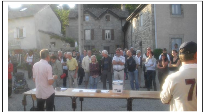
Débat public à la Brousse en août