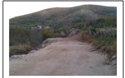
Chemin des bois aménagé à Finialettes