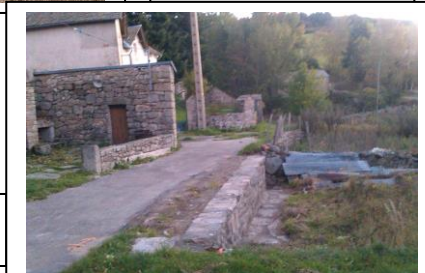
Rue de la Bugeade à la Brousse élargie