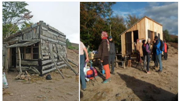
Avant et après

Pour y aller, garez-vous au col du Sapet, comptez 20 min de marche en remontant le GR70 vers le signal du Bougès.